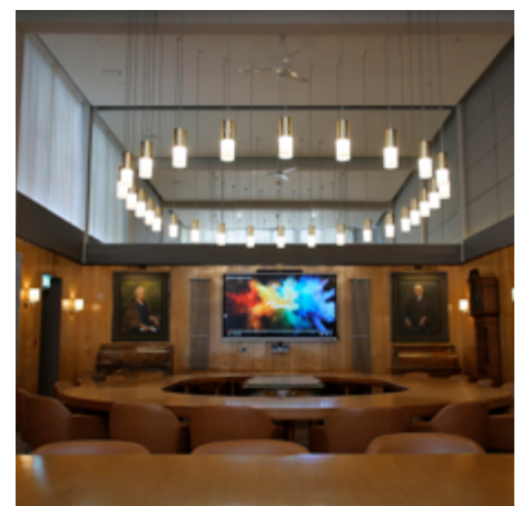
Ystafell y Bwrdd